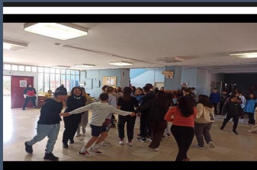
Ιταλική tarantella για όλους!

Οι Ιταλοί μαθητές, αφού ξεναγήθηκαν στο σχολείο και χάρηκαν την μικρή επίδειξη που έκανε η χορευτική ομάδα του σχολείου για αυτούς, σα μικρή γιορτούλα που τελείωσε με μικρό αυθόρμητο ξεφάντωμα σε ρυθμούς ιταλικής ταραντέλλας, ένωσαν ακόμη πιο ελεύθερα, είναι φιλόξενη η Μάνδρα μας άλλωστε. Αφού έγιναν λοιπόν όλα τα παιδιά μια παρέα, με γέλια και ανταλλαγές τηλεφώνων και προσωπικών «λογαριασμών»,